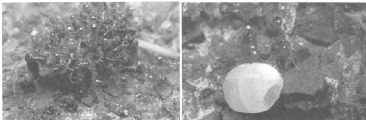
図1 硫黄島からの侵入の危険性があるアカカミアリ (左) シマグワの実に群がる。(右) 供え物の米を持ち去る。