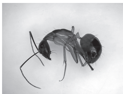
図2 Camponotus maculatus (Fabricius, 1782), 小型職蟻 (体長約 8 mm).