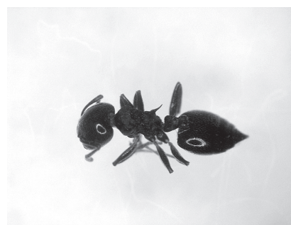
図3 Crematogaster sp. nr. castanea Smith, 1858, 職蟻 (体長約 4 mm).