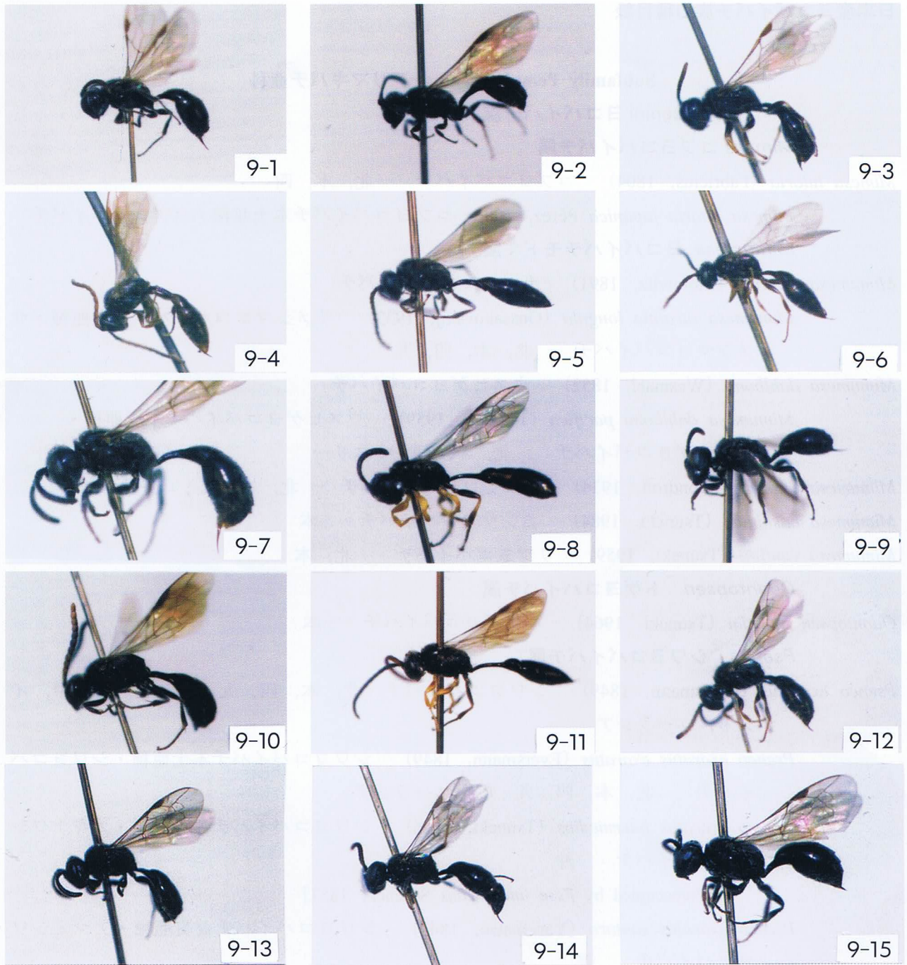
図9. マエダテバチ属 Psenulus (3).

9-1, メス, 9-2, オス, クロアシマエダテバチ Psenulus laevigatus (Schenck); 9-3, メス, 9-4, オス, ペレーマエダテバチ Psenulus lubricus (Pérez); 9-5, メス, 9-6, オス, マダラアシマエダテバチ Psenulus maculipes Tsuneki; 9-7, メス, 9-8, オス, ニッコウマエダテバチ Psenulus nikkoensis Tsuneki; 9-9, メス, 9-10, オス, オガサワラマエダテバチ Psenulus ogasawaranus Tsuneki; 9-11, メス, 9-12, オス, エゾマエダテバチ Psenulus gussakovskiji Van Lith; 9-13, メス, 9-14, オス, ヤマトマエダテバチ Psenulus pallipes (Panzer); 9-15, メス, 9-16, オス, タナカマエダテバチ Psenulus tanakai Tsuneki.