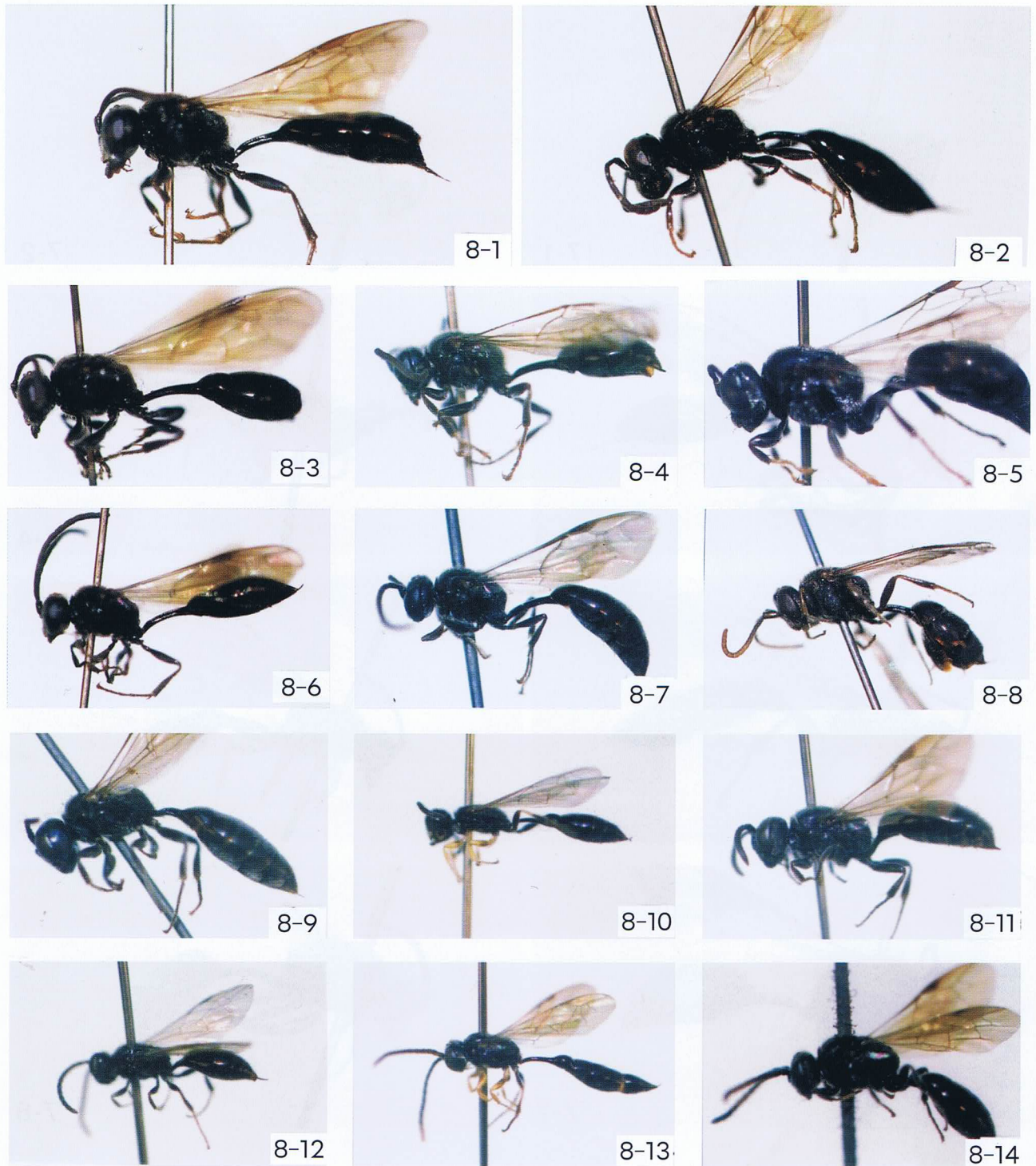
図8. ヨコバイバチ属 Psen (4) 及びマエダテバチ属 Psenulus (2).

8-1, メス, ベットウヨコバイバチ Psen bettoh Tsuneki ; 8-2, メス, リチャーズヨコバイバチ Psen richardsi Tsuneki ; 8-3, メス, 8-4, オス, タカミネヨコバイバチ Psen seminitidus Van Lith ; 8-5, メス, 8-6, オス, オオアゴヨコバイバチ Psen ussuriensis Van Lith ; 8-7, メス, コウライヨコバイバチ Psen koreanus Tsuneki ; 8-8, オス, ミヤギノヨコバイバチ Psen miyagino Tsuneki.